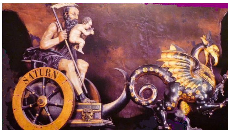
Der seine Kinder fressende Planetenherrscher Saturn / Thurse