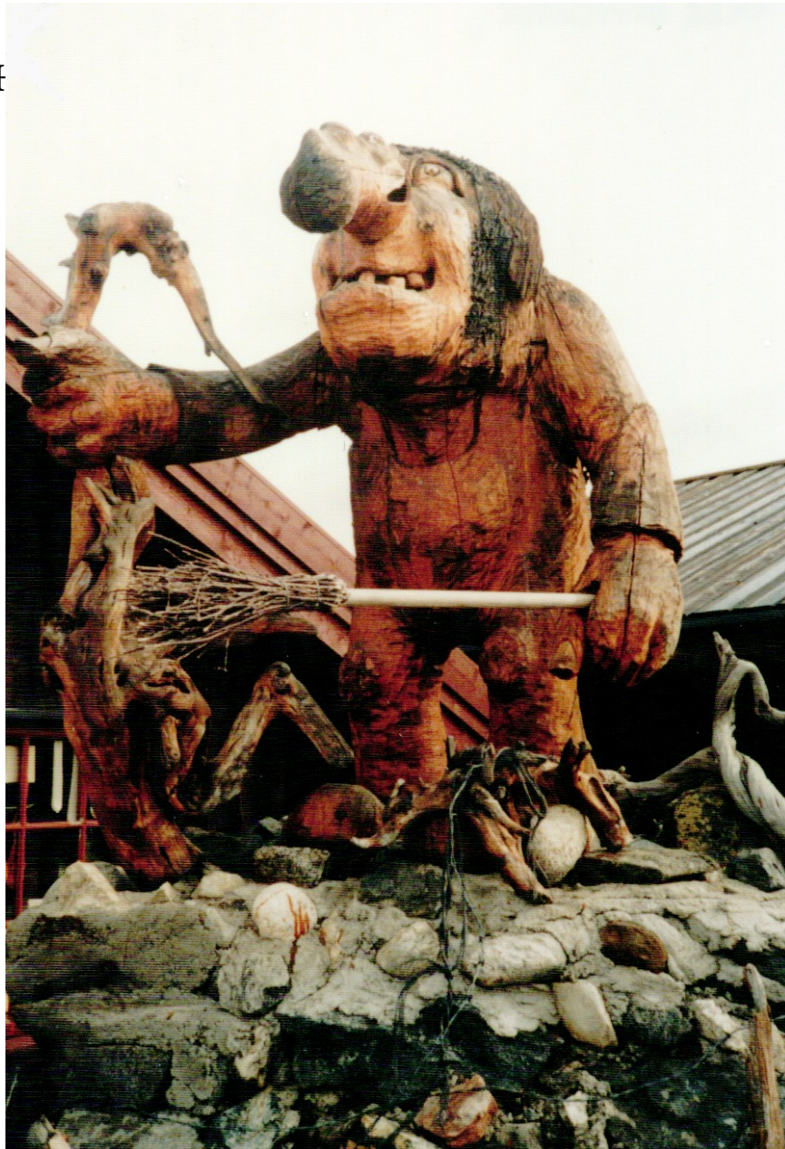
Skandinavisches Vorstellungsbild vom Troll/Thurse in Jutunheimen (Riesenheim / Norwegen) bei Dorregubbenhall, errichtet 1938 (Foto: 16.07.1987)