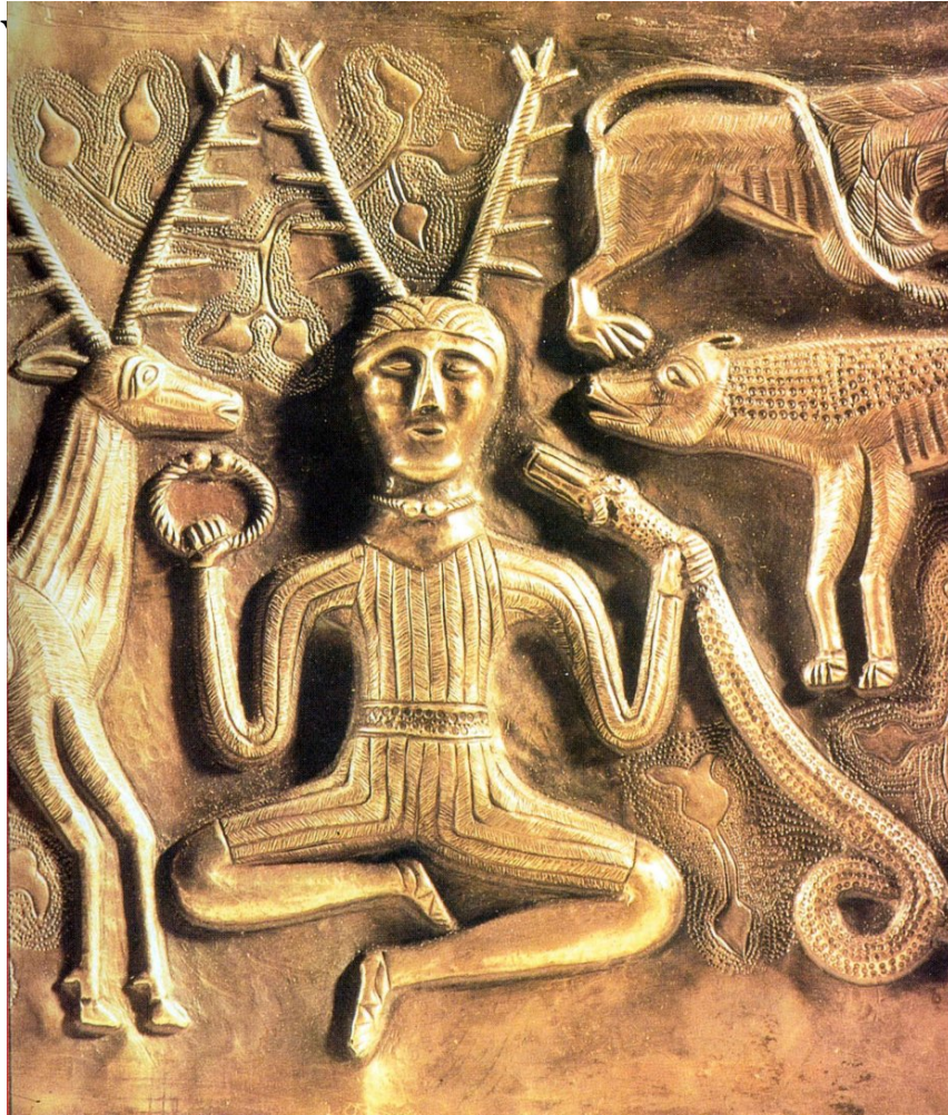
Die keltische Gottheit Esus-Cernunnos auf dem

Ausschnitt aus Platte 2 des Silberkessels von Gundestrup aus Jütland. Esus-Cernunnos sitzt zwischen den symbolhaften kosmischen Polen, des solaren Hirsches und der chthonischen Schlange und dem Wolf (mythischer Lichtfeind bzw. Sonnenjäger). Das bedeutet, Licht und Schatten, Höhe und Tiefe, Geist und Materie vereinigen sich in ihm und sind somit auch von seinen Gläubigen in der Yoga-Geistreise zu durchmessen -, ganz unabhängig davon wie die von antiken Schriftstellern erwähnten Seelenreisen in den alten Kulturen, auch der druidischen, namentlich benannt wurden. Verbindungsversuche aus dem grobstrukturellen Leiblichen hin zum numinosen, rein Geistigen waren es --, und Yoga heißt Verbindung.