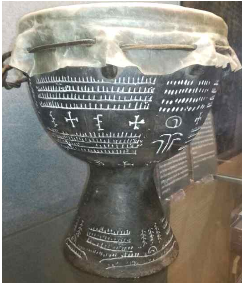
Kalender-Trommel von Hornsömmern