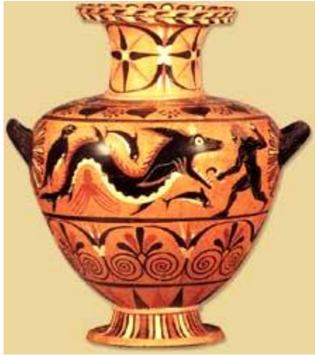
Abb. 7 - Herakles kämpft gegen das Meeresungeheuer Ketos bei Troja Kretische Vase, 5. Jh. v.0