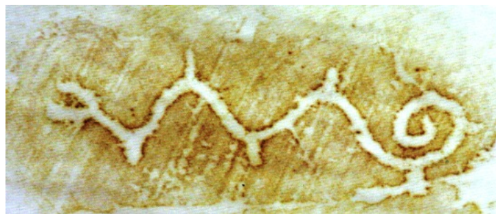
Abb. 3 - Der mythische Tazelwurm im bronzezeitlichen Felsritzbild von Järrestad / Skane / Schweden - ca. 1.500/1.000 v.u.

Nach dieser Vorarbeit wird es dem Studierenden klar, dass sich zum Nibelungenlied im Wesentlichen zwei Sagenkreise zusammengeschoben haben: 1. der uralte indogermanische, mindestens schon bronzezeitliche Mythos vom Lichthelden der den Winter- und Finsternisdrachen bekämpft und 2. die reale Historie vom Cheruskerprinzen Armin, dem Sieger über den römischen Drachenzurm, einer in den europäischen Norden hineinkriechenden erbarmungslosen und grauenerregenden Militärmaschinerie. Das militärische Ungeheuer Rom, von einer bis dato unbekanntenen mörderischen Perfektion und Konsequenz, herauszufordern und einen Sieg davonzutragen, war so gewaltig, so neu und so beglückend für die römisch versklavten Völker, dass es für diese nie mehr aus dem Gedächtnis verschwinden konnte. So besteht der strahlende Held Siegfried einmal aus dem altnordisch-vorgeschichtlichen Heilbringer, dem eddischen Helgi sowie dem Armin aus der cherusker-fürstlichen Sig-Sippe. Sämtliche sagenhaft verklärte Einzelzüge des Nibelungenliedes und des Siegfried-Mythos sind in den Völkerwanderungsturbulenzen und im Leben des Cheruskerfürsten wiederzufinden. Der deutsche hochverdiente Germanist Otto Höfler (1901-1987) erkannte bereits die Identität des realen mit dem Sagenhelden: „ Siegfried, Arminius und der Nibelungenhort “, 1978.