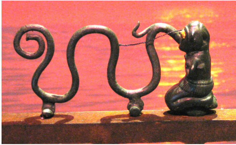
Abb. 2 - Bronzezeitlicher Fund von Fårdal in Nordjylland - Steckfiguren für ein Kultschiffchen: Schlange und kniende Göttin, die - nach Öffnung in ihrer erhobenen rechten Hand zu schließen - einen Speer gehalten hat.

Nach dieser Vorarbeit wird es dem Studierenden klar, dass sich zum Nibelungenlied im Wesentlichen zwei Sagenkreise zusammengeschoben haben: 1. der uralte indogermanische, mindestens schon bronzezeitliche Mythos vom Lichthelden der den Winter- und Finsternisdrachen bekämpft und 2. die reale Historie vom Cheruskerprinzen Armin, dem Sieger über den römischen Drachenzurm, einer in den europäischen Norden hineinkriechenden erbarmungslosen und grauenerregenden Militärmaschinerie. Das militärische Ungeheuer Rom, von einer bis dato unbekanntenen mörderischen Perfektion und Konsequenz, herauszufordern und einen Sieg davonzutragen, war so gewaltig, so neu und so beglückend für die römisch versklavten Völker, dass es für diese nie mehr aus dem Gedächtnis verschwinden konnte. So besteht der strahlende Held Siegfried einmal aus dem altnordisch-vorgeschichtlichen Heilbringer, dem eddischen Helgi sowie dem Armin aus der cherusker-fürstlichen Sig-Sippe. Sämtliche sagenhaft verklärte Einzelzüge des Nibelungenliedes und des Siegfried-Mythos sind in den Völkerwanderungsturbulenzen und im Leben des Cheruskerfürsten wiederzufinden. Der deutsche hochverdiente Germanist Otto Höfler (1901-1987) erkannte bereits die Identität des realen mit dem Sagenhelden: „ Siegfried, Arminius und der Nibelungenhort “, 1978.