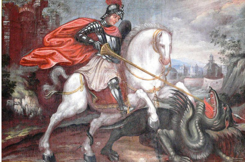
Abb. 8 - Der Drachentöter wurde verkirchenchristlicht als „Hi. Georg“ - Bild in Kirche von Limpach, Gemeinde Deggenhausertal / Bodensee

Wirklichkeit wohl aus diesem Beutegut der Sieger, welches vorher das Raubgut römischer Beutemacher war. Ein Teil der Beute wird im sogenannten „ Silberschatz von Hildesheim “ zu erblicken sein. Es handelt sich dabei um den größten antiken Edelmetallfund in Deutschland. Beim Galgenberg von Hildesheim wurde er entdeckt. Sein Gewicht liegt bei 54 kg. Verzierte Prunkbecher von erlesener Schönheit, Tafelgeschirr, vergoldete Karaffen, Kasserollen, Theatermasken, ein Weinmischkrater wiegt knapp zehn kg. Modernste Analysen bestätigen es, die Sachen gehören exakt der Zeit der Armin-Schlacht an, sie werden als Dankopfer für die huldreichen Kriegsgötter in einem Sumpf bei Hildesheim in den Boden gelangt sein.