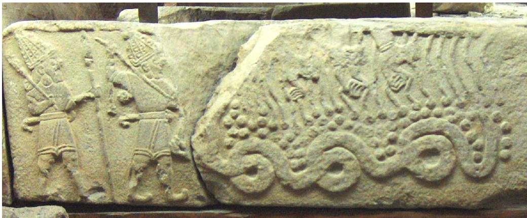
Abb. 5 - Der hethitische Wettergott Tarhunna / Teschup tötet den Drachen Illuyanka - spätluwisches Kalkstein-Relief aus Melid, 1050-850 v.0

3. Der Drachen: Die mythischen Vorstellungen von einem schlangenartigen Ungeheuer muss sehr alt sein, schon die bronzezeitlichen Felsbilder Skandinaviens zeigen derartige Wesen (Abb. 3) und die altägyptischen und hethitschen Mythen sagen ein Gleiches aus (Abb. 5). Unter dem Lindwurm oder Drachen ist seit alters die antigöttliche Macht zu verstehen, die den Sonnenheros bedrängt, um schließlich von ihm besiegt zu werden, damit die gute Zeit des Frühlings und des Sommers ihren Anfang nehmen kann. Wie in