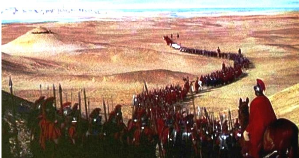
Abb. 9 - Römischer Heerwurm vor Alexandria, 30 v.0

Museum Osnabrück, zur Aussage, dass diese Funde alle „in engem Zusammenhang mit den Ereignissen des Jahres 9 n. Chr.“ stünden. Bewiesen wurde von den Archäologen bereits mit Sicherheit, dass zwischen dem Kalkrieser Berg und dem Großen Moor der uralte Weg durch vorgeschobene Wälle in einen Engpass umgestaltet worden sind. Das war Armins Falle. Inzwischen steht auch fest, dass hier ein ganzes System von Sperrwällen angelegt worden war. Die Luftbildprospektion und eine Schnittgrabung ergab ein 8 km östlich des Engpasses auf einem Sandrücken den typisch römischen Lagerwall. Die Funde an Militaria und Münzen kamen genau vor dem ausgegrabenen germanischen Wall gehäuft vor, unter dem Wall gab es keine und hinter dem Wall sehr wenig. Dieser Befund weist auf die schweren Kämpfe vor dem Wall hin. Dort fand sich auch die versilberte Ziermaske eines römischen Offiziers, die jetzt im Kulturhistorischen Museum in Osnabrück zu betrachten ist.