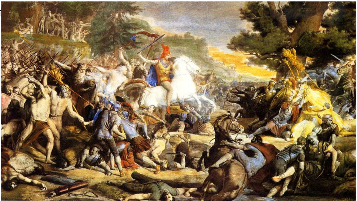
Abb. 1 - „Die Hermannsschlacht“ Gemälde von Friedrich Gunkel (1862–1864) - Es wurde zerstört im Weltkrieg II.